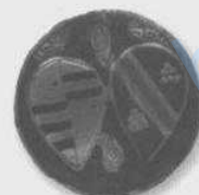
مدال بزرگ نقره‌ی ایتالیایی با نشان خاندان کریشی