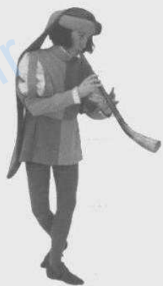
نوازنده‌ی قرون وسطا در حال نواختن سرنا