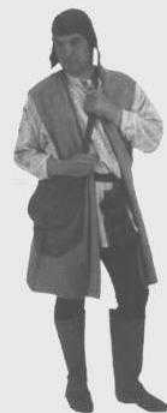
دهقان قرون وسطایی که لباس‌های مخصوص کار در مزرعه پوشیده است.