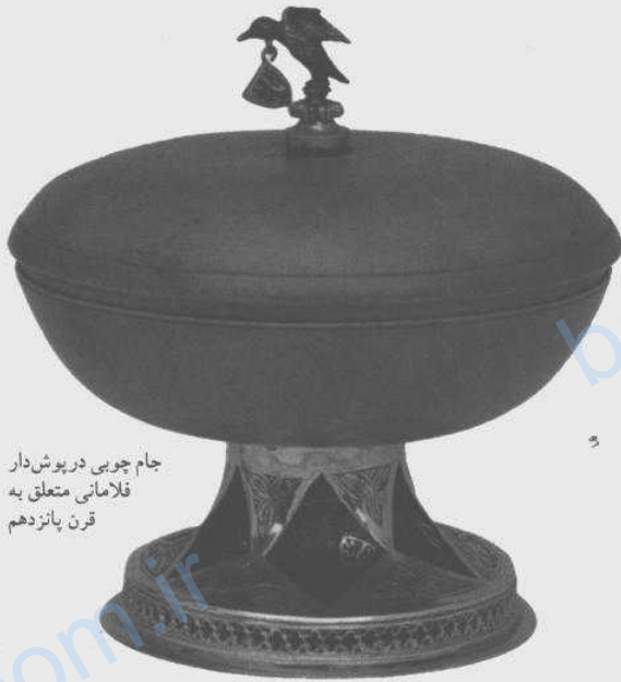
جام چوبی درپوش دار فلامانی متعلق به قرن پانزدهم