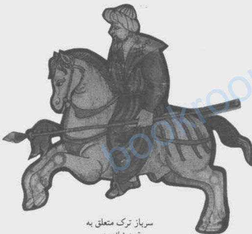
سرباز ترک متعلق به قرن شانزدهم