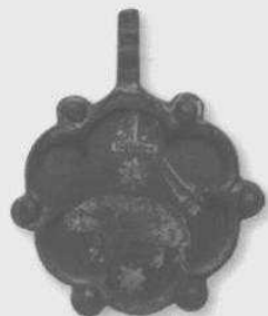
آویز انگلیسی متعلق به ملازم قلعه